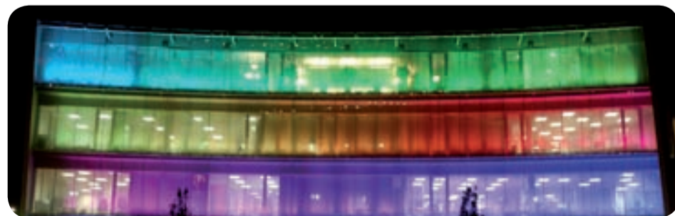
24h/24, 7J/7, la Direction Énergie de Gaz de Bordeaux veille sur le marché gazier

Concrètement : réactivité sur la répercussion des achats gaz, avec pour conséquence la baisse des tarifs d'octobre 2010.